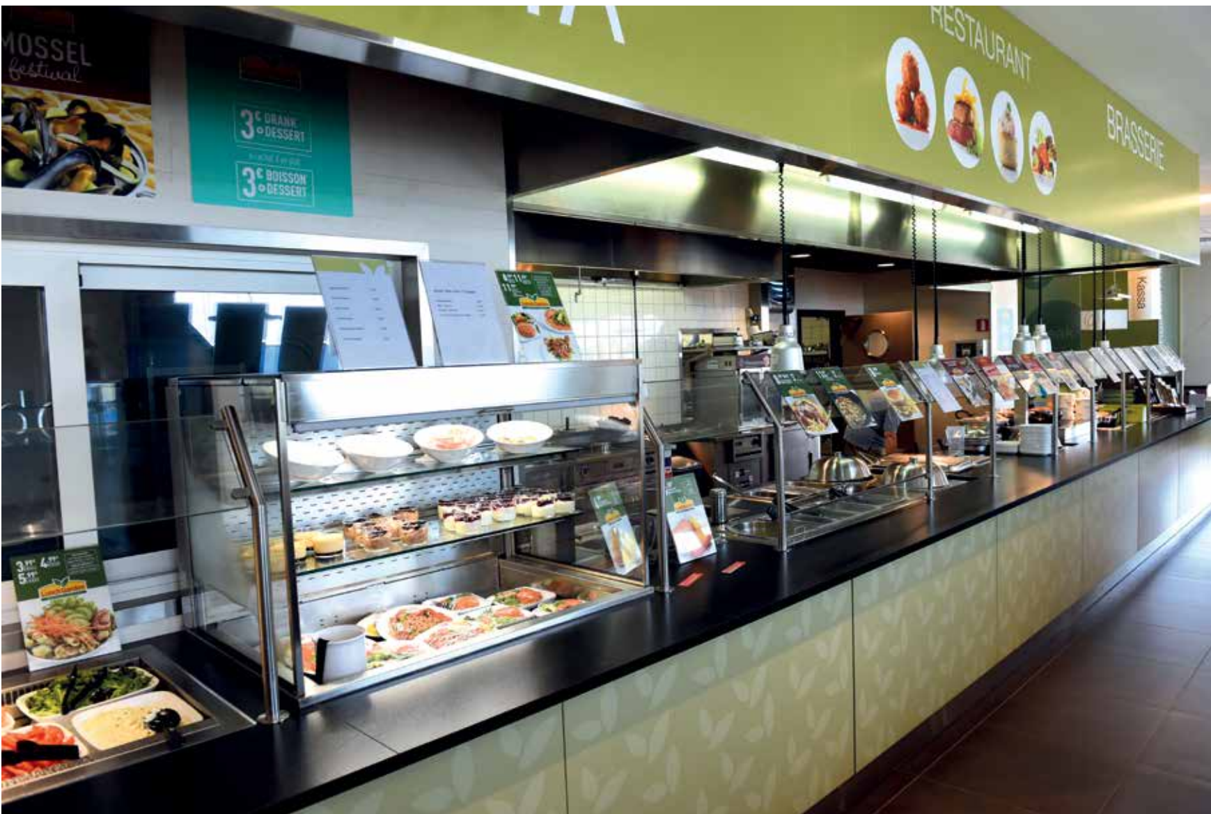
Proftech & De Bruyn neemt de volledige inrichting van retail- en horecazaken voor zijn rekening.

"Dat klopt," beaamt Clarijs. "Het basisprogramma is al redelijk toereikend, maar we hadden natuurlijk ook specifieke wensen op maat van Proftech & De Bruyn. Zo ontwikkelde Plenion voor ons een document waar onze installateurs de honderden gebruikte artikelen van een bar-installatie ter plaatse kunnen ingeven en zo automatisch afboeken. Die gegevens komen dan niet op de factuur voor de klant, maar worden wel geregistreerd als kost bij het project." ■